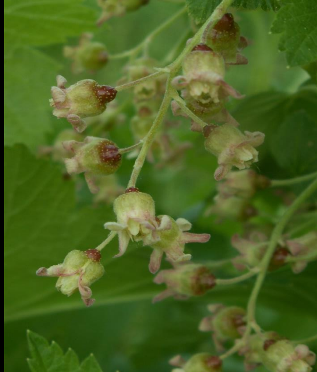
Inflorescence en grappe