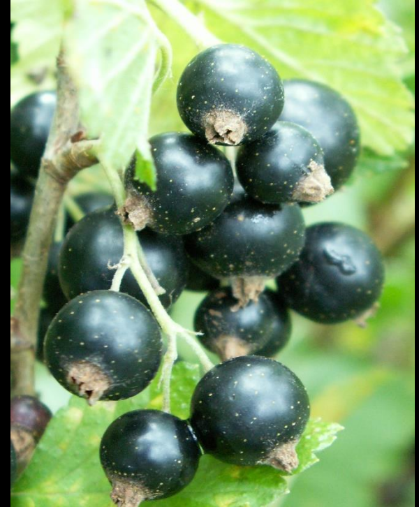
Baies noires riches en vitamine C