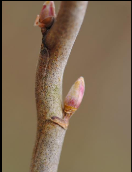
Rameaux d'un an avec bourgeons à bois